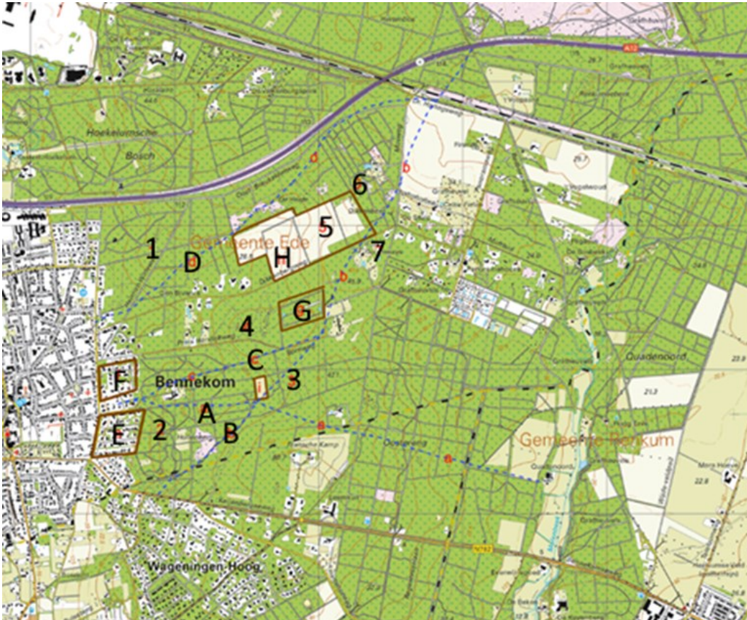
Afbeelding 3. Elementen van de kaart van Witteroos en Geelkercken op de huidige topografische kaart. (Met dank aan Erwin Brinkhuis en Geert Nijland). Links ligt Bennekom; rechts ligt het beekdal.

Achter de naam van de heg vermeldde Witteroos op veel plaatsen een jaartal. Dat is waarschijnlijk het jaar waarop de eerstvolgende hakbeurt was gepland. In de dalen tussen de heuvels lopen de wegen, die ook vaak een veldnaam hadden. Wij weten nu dat de heuvels elementen zijn van het stuwwallenlandschap van de Veluwe en dat de wegen veelal door de erosiedalen lopen.