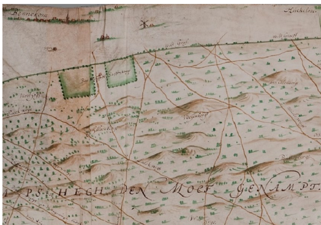
Afb. 2. Kaart van Nicolaes van Geelkercken, 1649. Ook deze kaart is georiënteerd op het westen; rechts is noord.