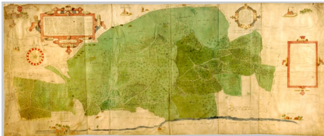
Afb. 1. Kaart van Thomas Witteroos, 1570. De kaart is georiënteerd op de westen; rechts is het noorden. (GA 0012 inv. nr. 4712)